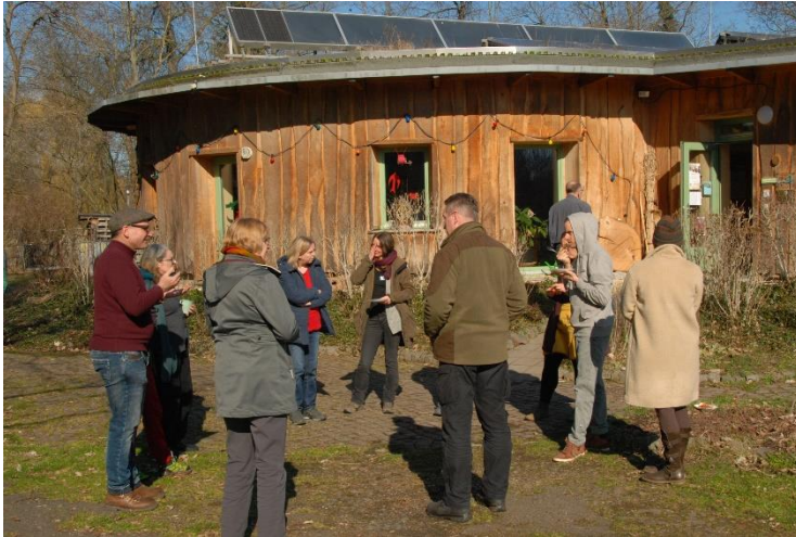
Gesprächsrunden vor dem Ökohaus Markkleeberg in frühlingshafter Atmosphäre